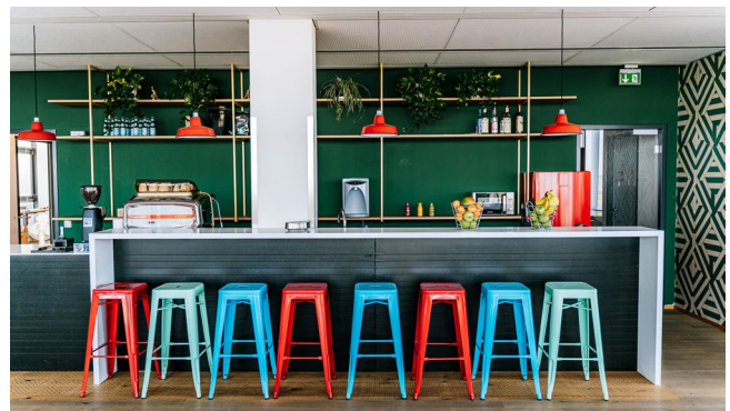
Bild 4 Die Office-Küche ist Mittelpunkt für gemeinsame Kochsessions mit italienischer Siebträgermaschine, Wasserspender und wöchentlicher Frischobstlieferung.