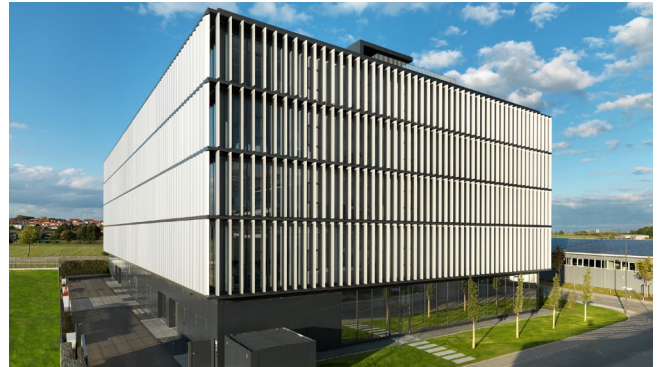
Bild 2 Das Headquartiers von CUBE brand communications.