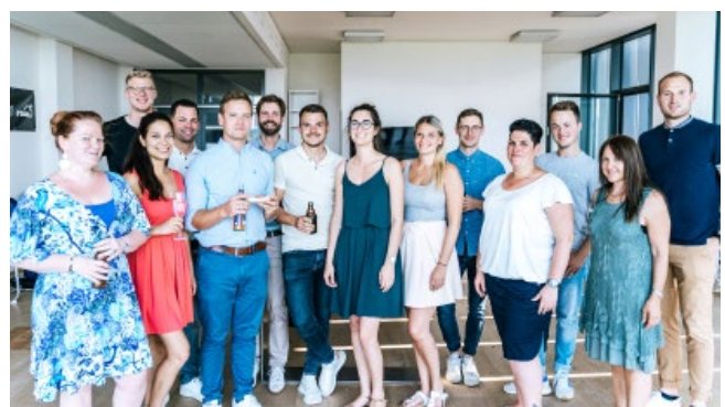
Bild 6 Gemeinsame Afterwork Events werden nach der Corona-Pandemie wieder regelmäßig durchgeführt.