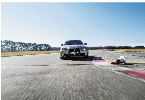
Bild 1: Mit den neuesten BMW Modellen Fahrspaß pur in Südtirol

CUBE brand communications GmbH Dr.-Ludwig-Kraus-Str. 2 85080 Gaimersheim