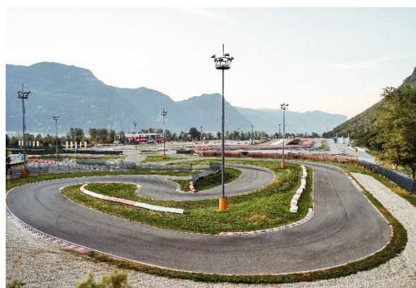
Bild 2: Neun Streckenabschnitte für vielfältige Trainingsprogramme – der Safety Park Südtirol