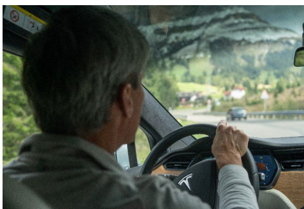
Bild 3: Eindrucksreiche Touren durch die Südtiroler Berge