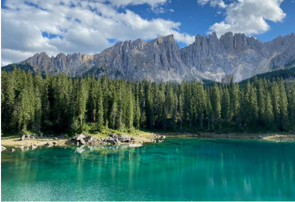
Bild 5: Phänomenale Landschaften in Südtirol