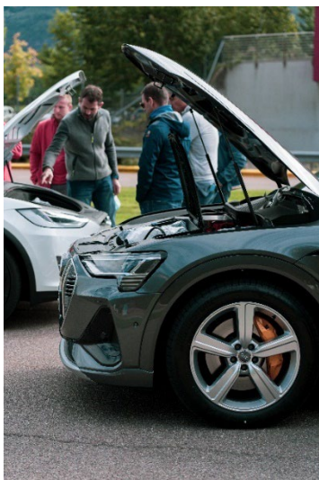
Bild 1: Der neue Erprobungshub steht Straßenerprobungsteams als technisches Basislager zur Verfügung