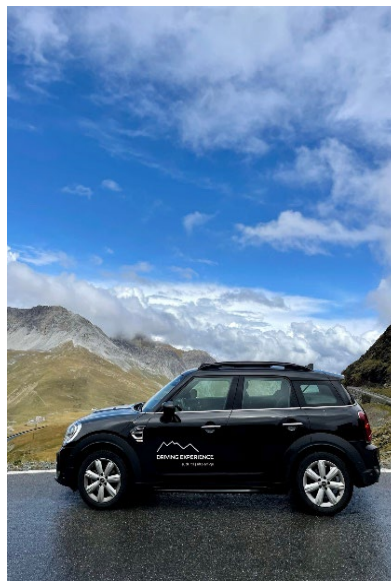
Bild 4: Stifser Joch Teil 2: Aufgeklärter Himmel im Dreiländereck