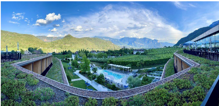
Bild 9: Traumhaftes Panorama von der Hotel-Terrasse aus