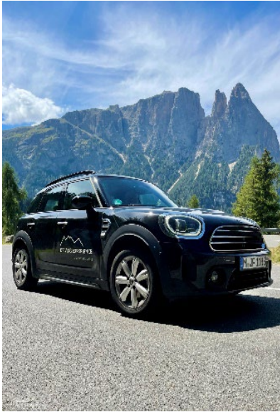
Bild 6: Markante Felsformation hinter Bozen: das Schlernmassiv