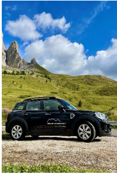
Bild 7: Ein Highlight auf 2.000 Höhenmetern: die Sella Ronda