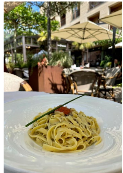
Bild 10: Kulinarische Köstlichkeiten gehören zum italienischen Dolce Vita dazu