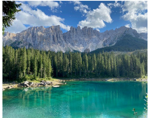
Bild 2: Wunderschöne Landschaft in Südtirol – der Karer See