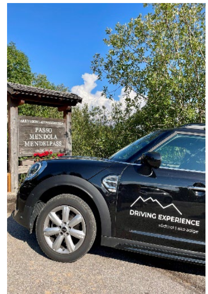
Bild 5: Der Mendelpass war eine von vielen Südtiroler Attraktionen, die angefahren wurden