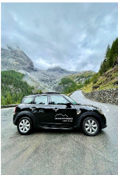
Bild 3: Stifser Joch Teil 1: Raue Hänge und Gletscher