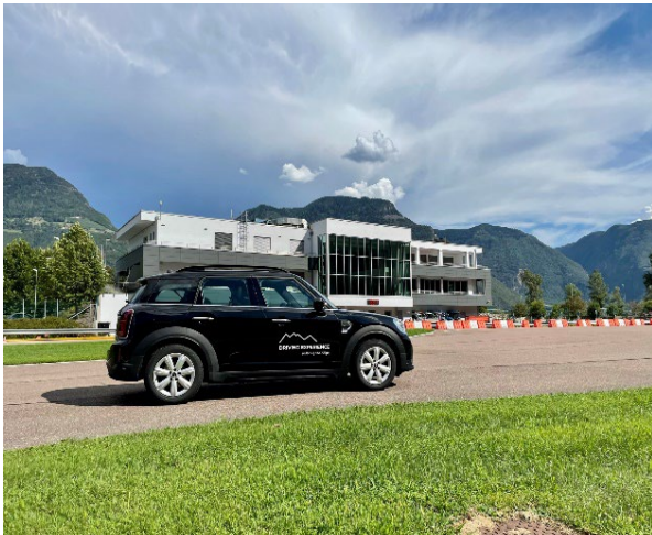
Bild 1: Vom Safety Park Südtirol aus startete Driving Experience Südtirol die Scouting-Tour mit einem gebrandeten Fahrzeug – bereitgestellt vom Kooperationspartner BMW rent | Mini rent