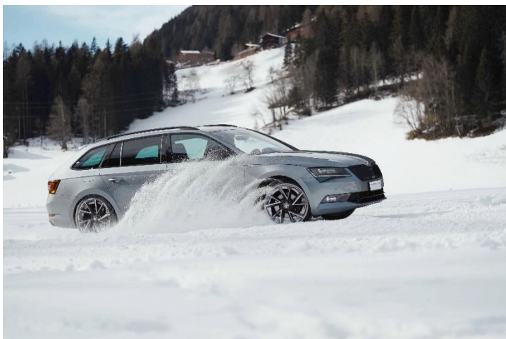
Bild 2: Drift Action im Winter Park