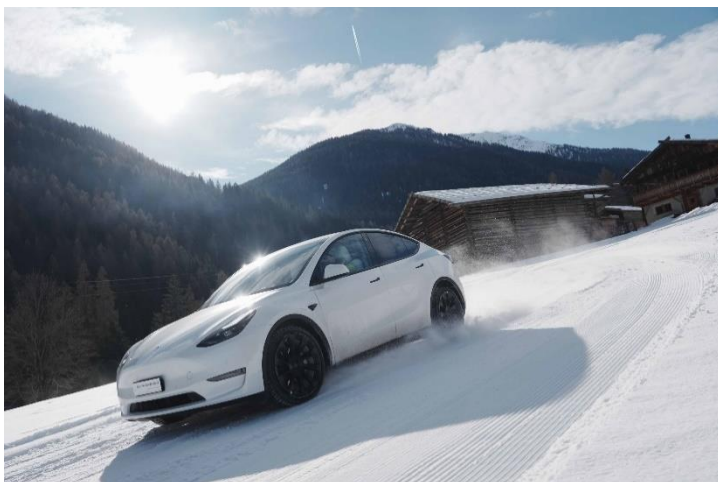
Bild 1: Testfahrt bei idealen Strecken- und Witterungsverhältnissen