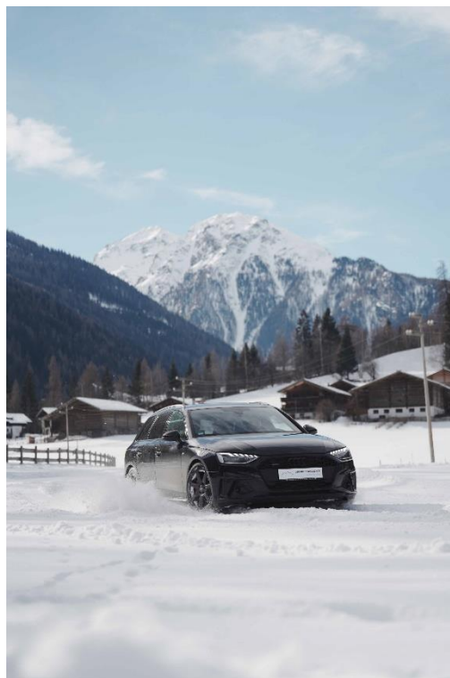
Bild 4: Fahrmanöver auf schneebedeckter Piste