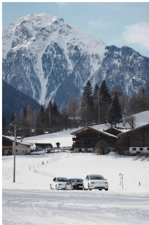
Bild 5: Winter Park in malerischer Umgebung